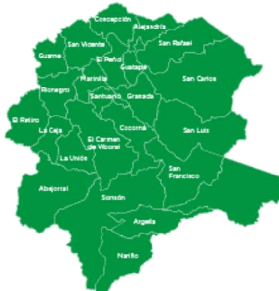
Ilustración 1. Mapa Subregión de Oriente