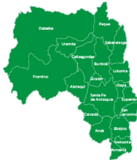
Ilustración 2. Mapa Subregión de Occidente