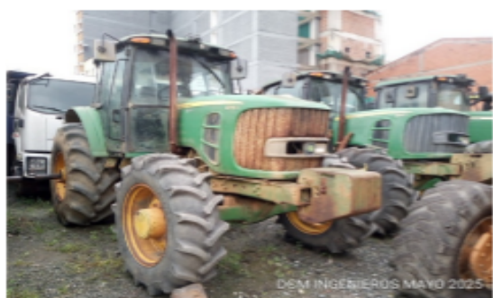
Imagen del equipo