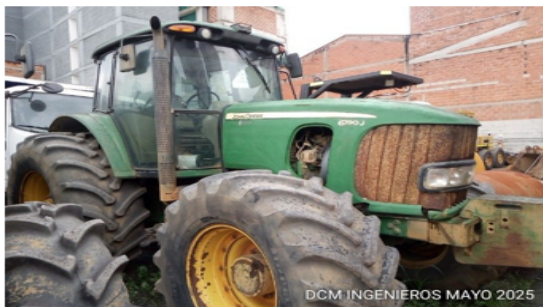
Imagen del equipo