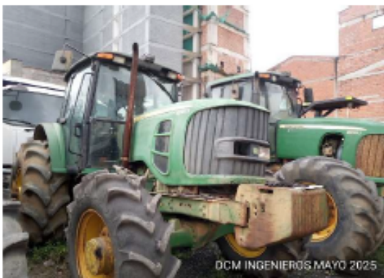
Imagen del equipo