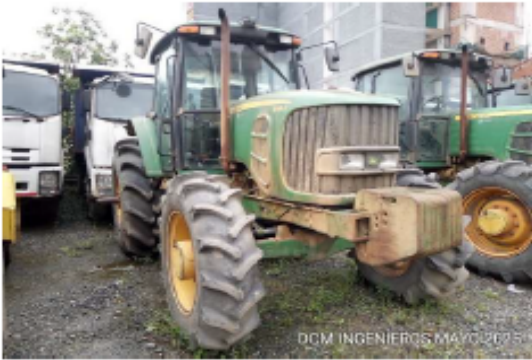
Imagen del equipo