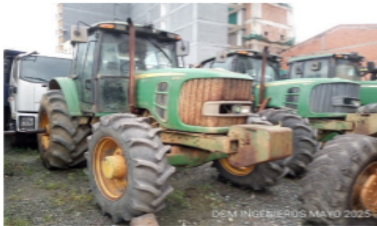
Imagen del equipo