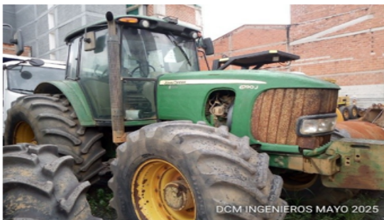
Imagen del equipo